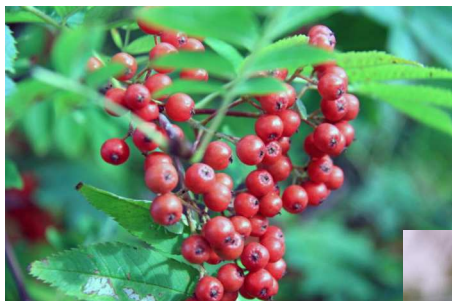
村の木「ナナカマド」