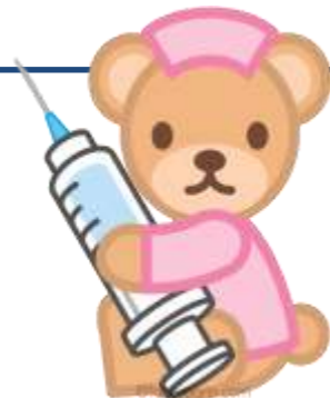
予防接種・特定疾患