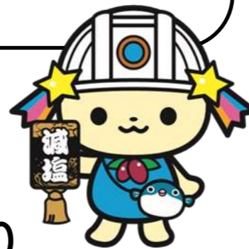
健康寿命まちづくり