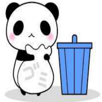
きれいな街づくり