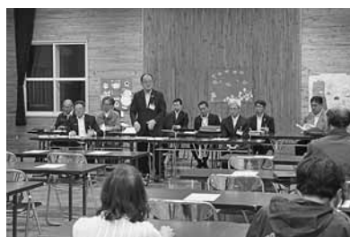
豊岬・明里・共成地区

住宅、空き家、除雪、ふるさと納税、しよさまる号（地域公共交通事業）、郷土資料館や海水浴場に関する事など、幅広い意見が寄せられました。