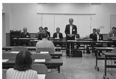
初山別・千代田地区