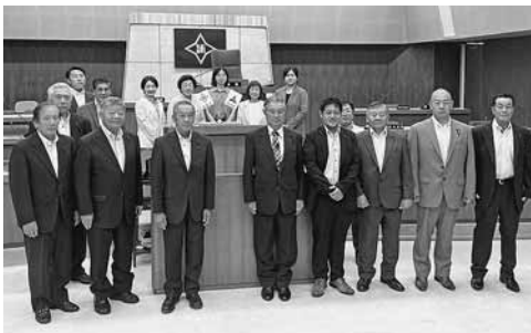
浦幌町議会議場にて

する意識を高めることが不可欠である。そのため、住民が議会をより身近に感じられる取り組みとして、議会モニター制度の導入や議会の実施方法の工夫が有効である。また、「風通しのよい議会」をキーワードに、誰もが分かりやすい表現で議会報を作成したり、議会活動を細やかに報告することも大切である。その上で、住民が議会に気軽に関わることのできる機会を多く設定することで、参画意識が高まるものと考ええる。また、議員のなり手不足という課題についても、こうした取り組みを継続して行い議員としてのやりがい発信することにより解消につながることを考える。今後に向けては、議員一人一人が住民の代表であることをより自覚し、よりよい街づくりを目指していく姿勢を示し、議員活動に真摯に取り組みPDCAサイクルを一つ一つ丁寧に積み上げていくことにより、住民からの議員活動への理解が得られるものと考ええる。