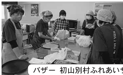
バザー 初山別村ふれあいサポーター「あい♡あい」