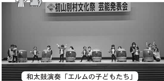
和太鼓演奏「エルムの子どもたち」