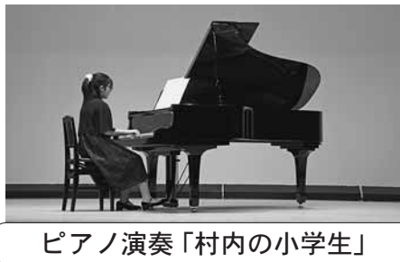
ピアノ演奏「村内の小学生」