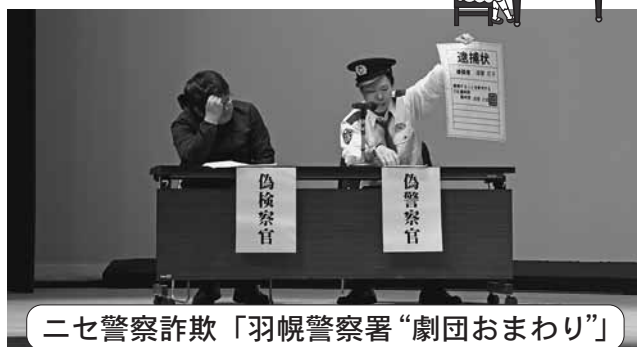
ニセ警察詐欺「羽幌警察署“劇団おまわり”」