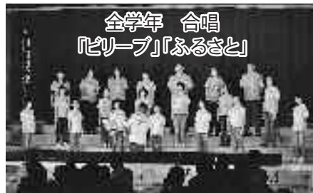
全学年 合唱 「ピリプ」「ふるさと」