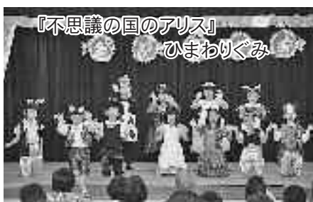
『不思議の国のアリス』 ひまわりぐみ