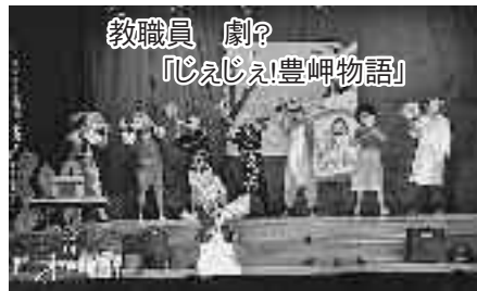
教職員 劇? 「じえじえ!豊岬物語」