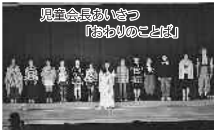
児童会長あいさつ 「おわりのことば」