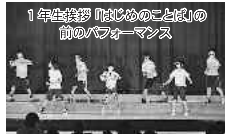
1年生挨拶「はじめのことば」の 前のパフォーマンス