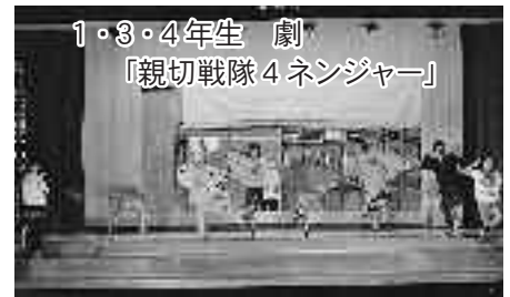
1・3・4年生 劇 「親切戦隊4 ネンジャー」