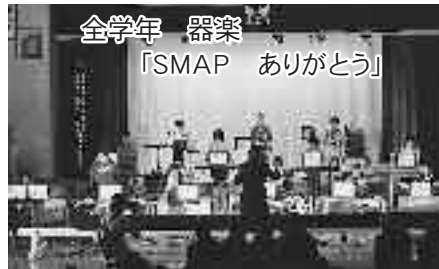
全学年 器楽 「SMAP ありがとう」