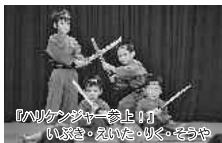
『ハリケンジャー参上!』 いぶき・えいた・りく・そうや