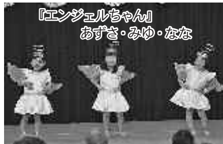
『エンジェルちゃん』 あずさ・みゆ・なな