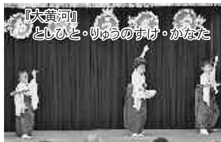
『大黄河』 としひと・りゅうのすけ・かなた