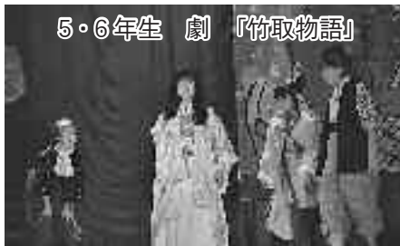
5・6年生 劇 「竹取物語」