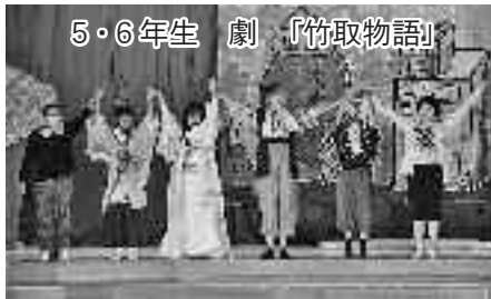
5・6年生 劇 「竹取物語」