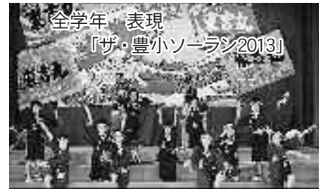
全学年 表現 「ザ・豊小ソーラン2013」