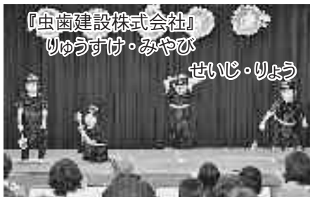
『虫歯建設株式会社』 りゅうすけ・みやび せいじ・りょう